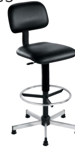
① Chaise haute similicuir