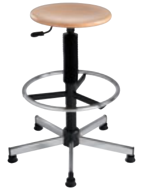
④ Tabouret bois