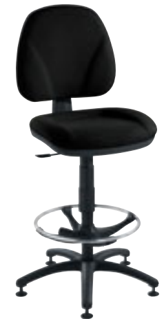
② Siège dessinateur dossier standard