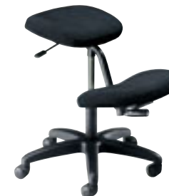
① Siège ergoforme