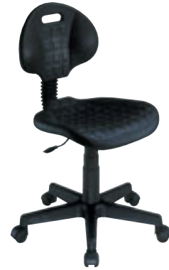
② Siège dactylo