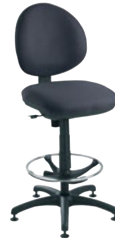
③ Siège dessinateur dossier rond