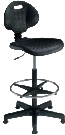
① Siège dessinateur