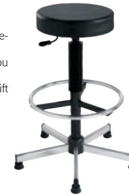
③ Tabouret similicuir