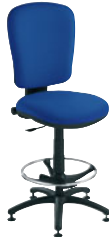
① Siège dessinateur haut dossier