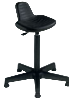
③ Tabouret assis-debout