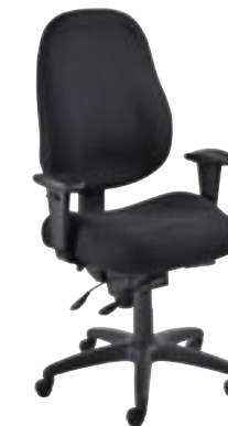
① Fauteuil avec accotoirs réglables