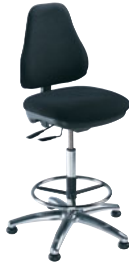
② Siège dessinateur