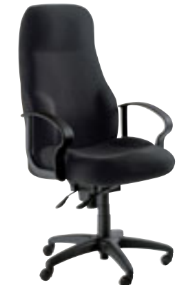
② Fauteuil haut dossier avec accotoirs fixes