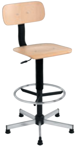
② Chaise haute bois